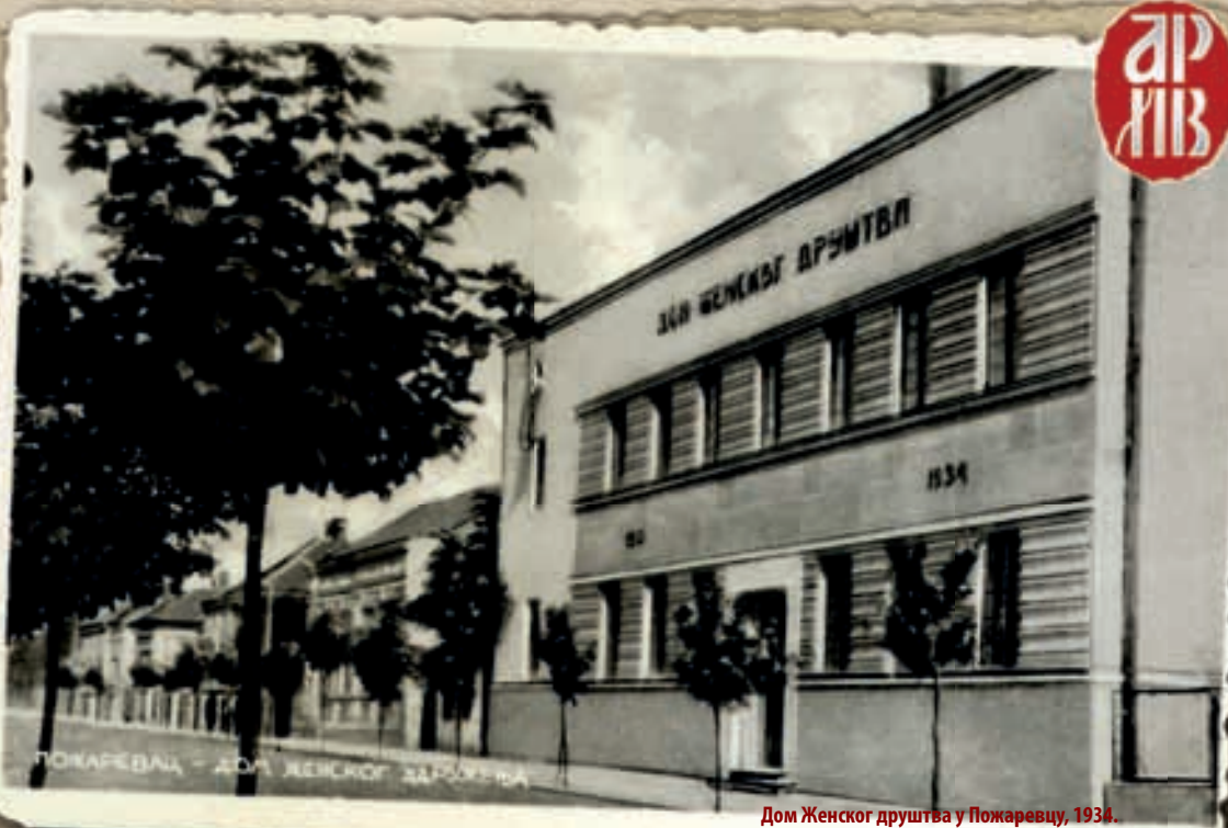
Дом Женског друштва у Пожаревцу, 1934. The House of Women's Association of Požarevac, 1934